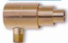
High Velocity Air Jet