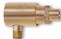
Adjustable Air Jet