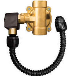
350 SCFM (9.912 l/min.) Modell 9064