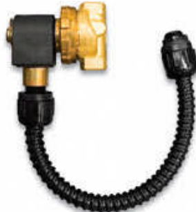
100 SCFM (2.832 l/min.) Modell 9056