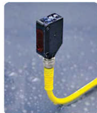
Fotoelektrischer Sensor des EFC

Der EFC hat einen einfachen elektrischen Anschluss für Spannungen von 100-240 V AC, wodurch er für Anwendungen auf der ganzen Welt geeignet ist. Der kompakte fotoelektrische Sensor verfügt über eine Empfindlichkeitseinstellung und erkennt Objekte bis zu einer Entfernung von 1 m. Er hat eine ausgezeichnete Festigkeit gegenüber Störungen und induktiven Lasten, die in Industrieumgebungen oft vorkommen, und kann mit der mitgelieferten Montagelasche leicht unter beengten Bedingungen montiert werden. Das Steuerungssystem bietet Flexibilität mit zahlreichen Ventilbetriebsarten und Verzögerungszeiten. Das Polycarbonat-Gehäuse ist für den Einsatz in unterschiedlichsten Anwendungsbereichen geeignet - sogar für Anwendungen in nassen Umgebungen.