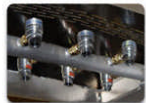
Air Amplifiers (Luftstromverstärker)