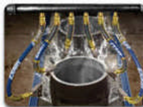
Super Air Nozzles (Luftdüsen)