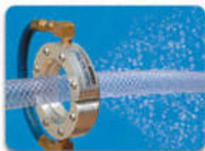
Super Air Wipe (Ringdüse)