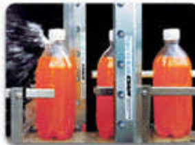
Super Air Knife (Luftvorhang)

Benutzen Sie den EFC, um mehr Luft mit den ausgeklügelten Luftströmungsgeräten von EXAIR zu sparen.