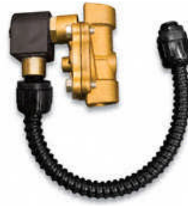
200 SCFM (5.664 l/min.) Modell 9057