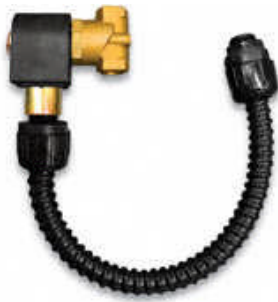
40 SCFM (1.132 l/min.) Modell 9055