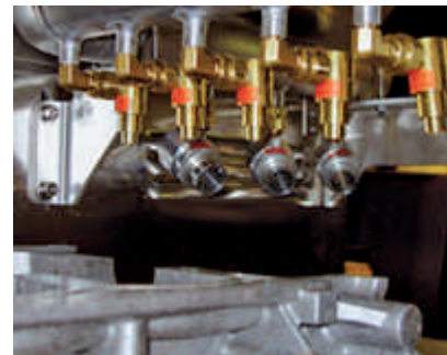
Eine Kombination von High Velocity Air Jets, Modell 6013, und verstellbaren Air Amplifiers, Modell 6042, trocknen dieses Maschinengussteil.