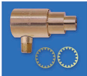
Das Modell 6313 Shim Set für den High Velocity Air Jet (siehe Foto) beinhaltet ein .006" (0.15mm) und ein .009" (0.23mm) dickes Shim. Ein .015" (0.38mm) ist werksseitig installiert.