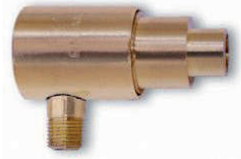
Modell 6013 - 1/8 NPT Außengewinde Material: Messing

(NPT-Gewinde / BSP Gewinde erhältlich – bitte bei Bestellung die Buchstaben „BP“ vor die Modellnummer setzen)