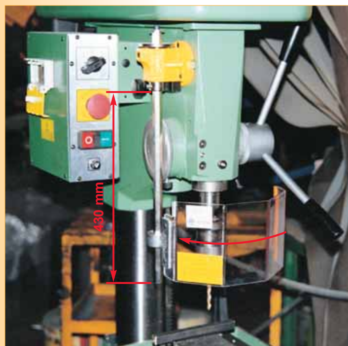
COD. ART. TR2 SP 2 kg ca.