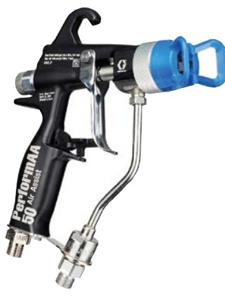
Die luftunterstützte Pistole PerformAA 50 spritzt mit 345 bar (5.000 psi) für Top-Leistung bei hohem Druck.