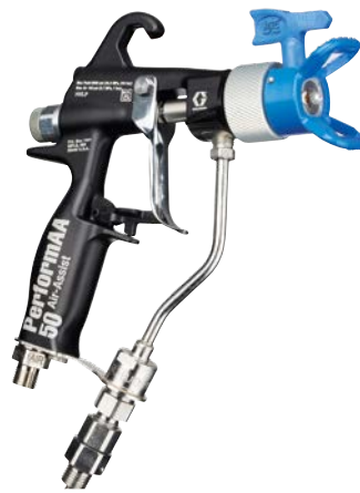
Die luftunterstützte Pistole PerformAA 50 RAC® spritzt mit einer Reverse-A-Clean®-Düse mit 345 bar (5.000 psi) für Hochdruckanwendungen.