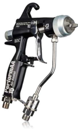
Die luftunterstützte Pistole PerformAA 15 spritzt mit 105 bar (1.500 psi) für optimale Leistung bei niedrigem und mittlerem Druck.