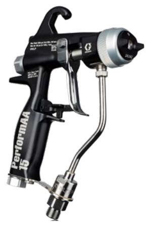
PerformAA Airless-Pistolen sind mit 105 bar (1.500 psi) für Anwendungen mit niedriger Viskosität und 345 bar (5.000 psi) für das Spritzen mit hohem Druck erhältlich.